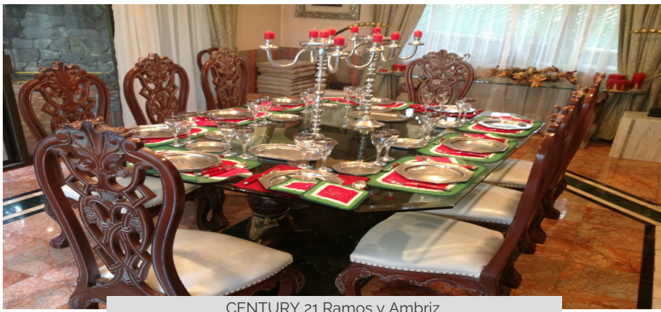
CENTURY 21 Ramos y Ambriz

Lomas Anahuac, Huixquilucan, Estado De México