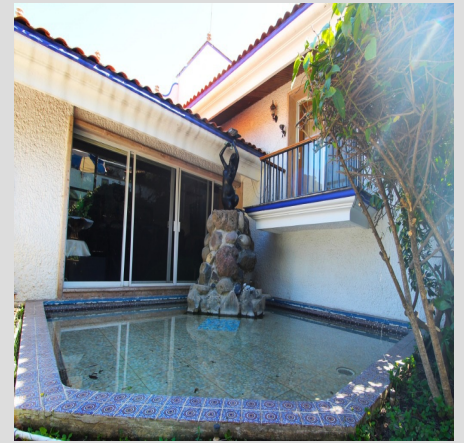
Bugambillas, Zapopan, Jalisco