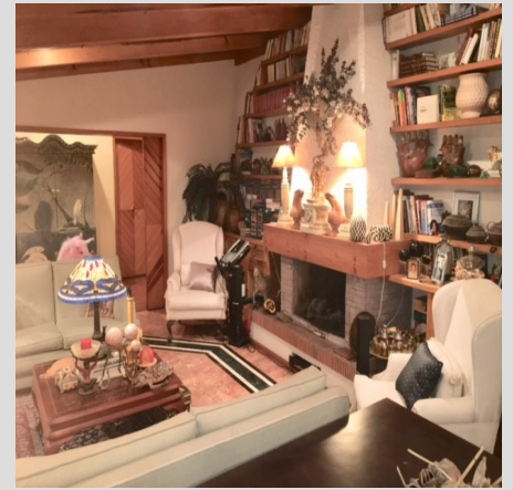
Lomas De Las Palmas, Huixquilucan, Estado De México