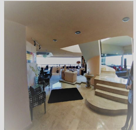
La Herradura, Huixquilucan, Estado De México