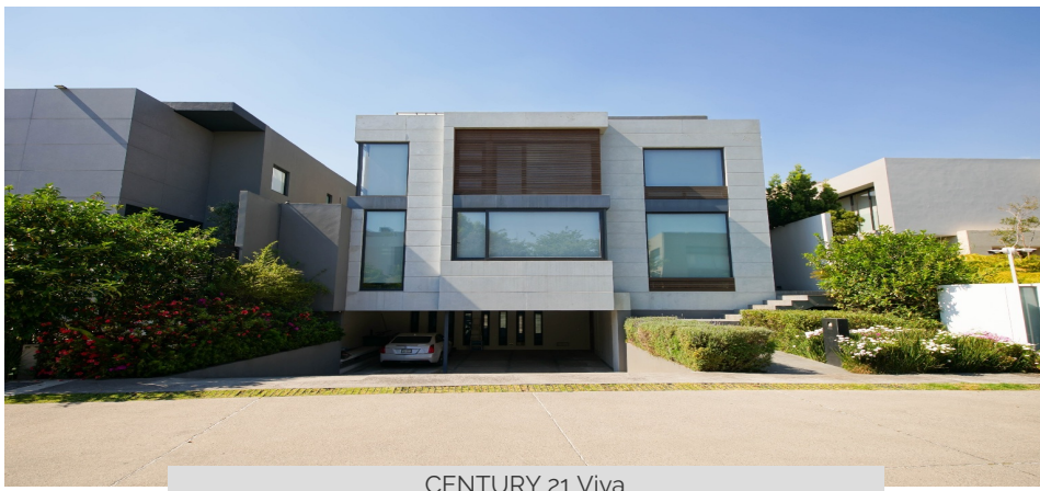
CENTURY 21 Viva

Cumbres de Sta. Fe, Cuajimalpa De Morelos, Ciudad De México