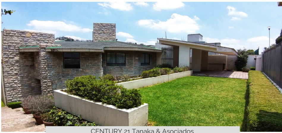
CENTURY 21 Tanaka & Asociados

Bosque de las Lomas, Huixquilucan, Estado De México