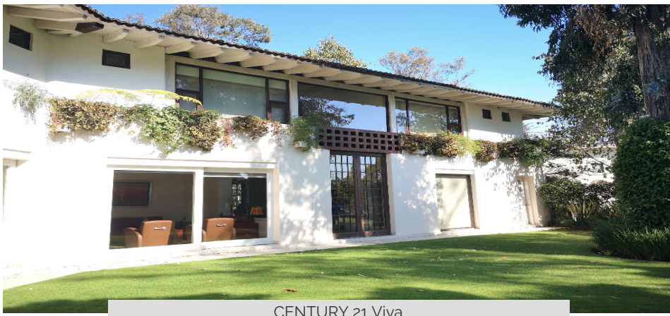
CENTURY 21 Viva

Olivar De Los Padres, Alvaro Obregón, Ciudad De México