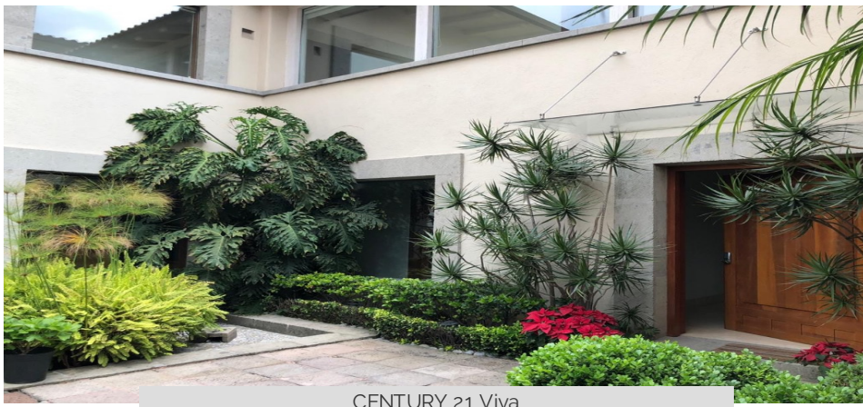
CENTURY 21 Viva

Jardines Del Pedregal, Alvaro Obregón, Ciudad De México