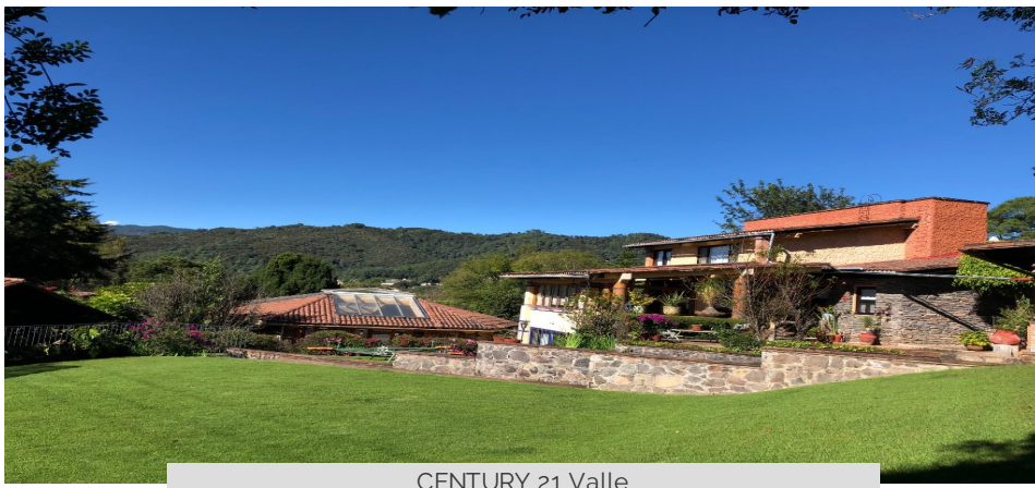
CENTURY 21 Valle

Valle De Bravo, Valle De Bravo, Estado De México